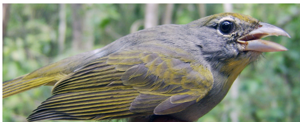
Tángara yucateca ( Piranga roseogularis ).

Considerando el concepto de especie biológica, en México están representadas 1060 especies (Escalante y otros, 1998), de manera que las especies registradas en Yucatán representan el 43% de la avifauna nacional y el 84% de las aves con registro en la Península de Yucatán (MacKinnon, 2005).