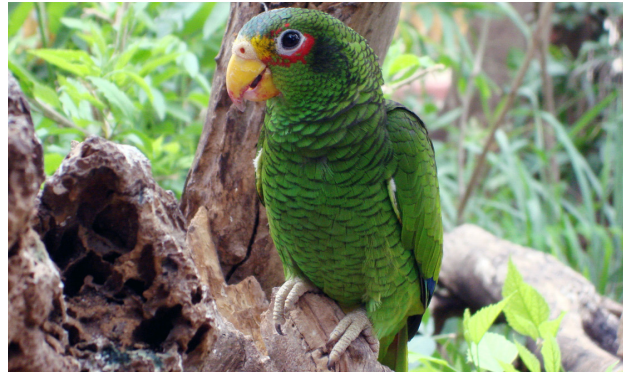
Loro yucateco ( Amazona xantholora ).

De las especies de aves introducidas al estado se pueden considerar cinco especies. Entre ellas se encuentra Columba livia (paloma doméstica), estrechamente asociada a los asentamientos humanos. Otra paloma en mención para el estado es Streptopelia decaocto (paloma de collar), una de las aves más comunes y abundantes en el mercado de mascotas. Actualmente se observan grupos reproductivos de hasta seis individuos en zonas de la costa y la ciudad de Mérida.