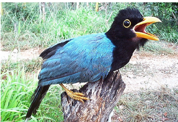
Chara yucateca o Chel ( Cyanocorax yucatanicus ).

De acuerdo con la Convención Internacional para el Comercio de Especies de Fauna y Flora Silvestres (CITES), en el estado se distribuyen dos especies en alguno de sus apéndices ( Falco peregrinus en el Apéndice I y Ramphastos sulfuratus en el Apéndice II).