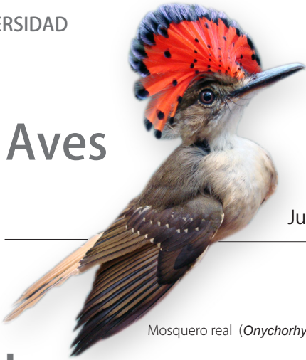
Mosquero real ( Onychorhynchus coronatus ).