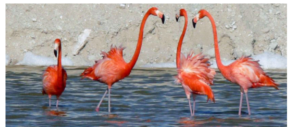
Flamenco rosa ( Phoenicopterus ruber ).

Entre los programas de conservación que se desarrollan en la entidad a favor de algunas especies consideradas como especies bandera, particularmente de los humedales de la costa norte, están el programa de anillamiento de Phoenicopterus ruber (flamenco) que desde el año 2000 opera en la Reserva de la Biosfera Ría Lagartos; y el recientemente implementado programa de mejoramiento de humedales para la recuperación de Cairina moschata (pato real o box pato).