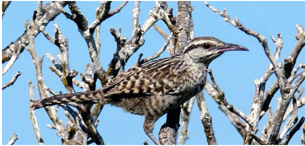
Matraca yucateca ( Campylorhynchus yucatanicus ) / Cardenal ( Cardinalis cardinalis ).